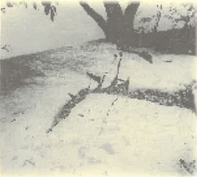
Playa de Mármol