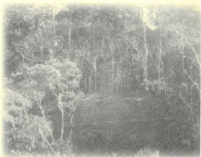
Panoramas en la cuenca de Río Claro.