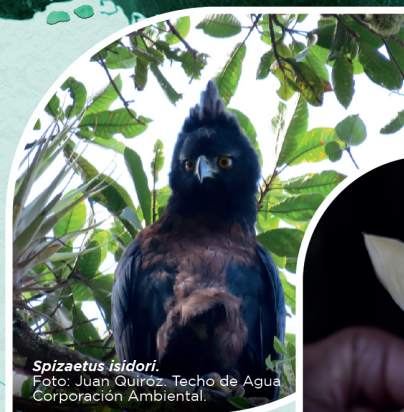
Spizaetus isidori .