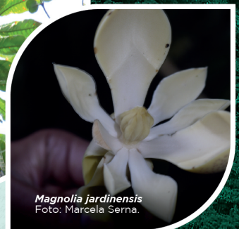
Magnolia jardinensis